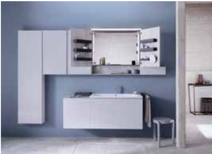
Das Möbelkonzept der Badserie Keramag Acanto von Geberit ermöglicht vielfältige Kombinationen von Sanitärkeramik, Möbeln und Acrylprodukten, um die individuellen Bedürfnisse der Nutzer zu erfüllen – je nach Raumgröße oder benötigtem Stauraum.

Die Komplettbadserie Acanto ermöglicht besonders vielfältige Kombinationen von Sanitärkeramik, Möbeln und Acrylprodukten, um die individuellen Bedürfnisse der Nutzer zu erfüllen. Besonderen Fokus hat man auf die optimale Nutzung des Stauraums gelegt.