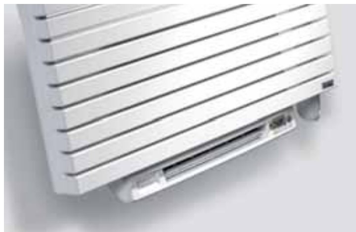
Der elektrische Badheizkörper Carré mit integriertem Blower

Die ideale Kombination aus Ökodesign und ökologisch verantwortungsvollem Heizen: Elektrische Badheizkörper mit integriertem Blower verfügen über eine selbstprogrammierende intelligente Steuerung, die auf einer Präsenzmeldung basiert. Dadurch wird keine Kilowattstunde zu viel verbraucht! Das Gerät erfasst über den Bewegungssensor das jeweilige Nutzerschema und erstellt auf dieser Basis selbstständig ein Wochenprogramm. Dieses lässt sich jederzeit bequem anpassen. Hierfür ist die Blower-Einheit mit einem bei Berührung aufleuchtenden Touch-Display ausgestattet. Die Ausformung des Luftauslasses sorgt für eine aerodynamische Optimierung der Warmluft-Zirkulation. Für eine bequeme und gebrauchsfreundliche Wartung ist der Staubfilter an der Rückseite untergebracht. Dieses praktische Zusatzmodul ist für fünf elektrische Badheizkörper von Vasco erhältlich: Agave, Aster, Carré Bad, Iris und Niva. > <