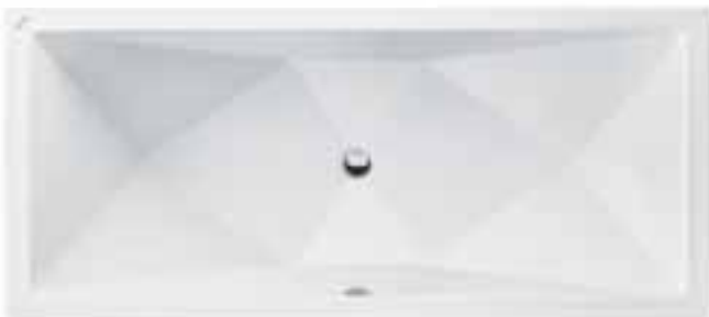
Die neue Serie DAIMANA in Diamantschliff-optik.