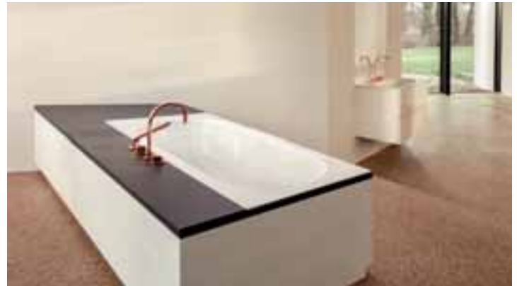
Mit ihrem acht Millimeter schlanken Wannenrand und Eckradien von fünf Millimetern eignet sich die neue BetteStarlet Spirit perfekt für den flächenbündigen Einbau. Die Liegefläche ist großzügig ausgelegt und der breite Wannenrand dient als bequeme Ablage für die Unterarme und als Stellfläche. Harmonisches Ensemble: Ein idealer Partner zur BetteStarlet Spirit ist der designverwandte Einbau-Waschtisch BetteComodo, der ebenfalls aus glasiertem Titan-Stahl gefertigt wird.