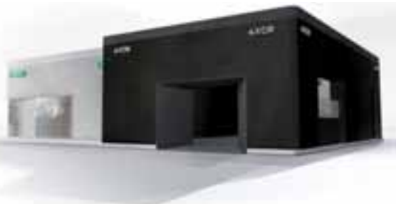
Vom 17.-22. April 2018 können sich Fachbesucher und die designaffine Öffentlichkeit von den zahlreichen Neuheiten der beiden Marken auf einem in zwei Markenwelten geteilten Stand auf dem Messegelände Rho überzeugen. Halle 22, Stand F23/27.

Vom 17.-22. April 2018 können sich Fachbesucher und die designaffine Öffentlichkeit von den zahlreichen Neuheiten der beiden Marken AXOR und hansgrohe auf einem in zwei Markenwelten geteilten Stand auf dem Messegelände Rho überzeugen. „Mit unseren starken Marken