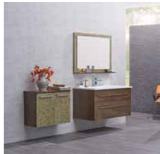
Ein Stück Natur im Bad. Die Haylander aus der Serie Classic begeistern mit einer Oberfläche aus echtem Heu und wunderbar duftenden Heublumen aus den Tiroler Bergen. Hier in der Kombination mit der neuen Oberfläche Ferrusta, einem hochwertigem Material in Corten-Optik.

Die von erlesenem Carrara Marmor und modernen, architektonischen Steinoptiken inspirierten Feinsteinzeugoberflächen werden dabei mit exakten Gehrungskanten auf den Plattenkern aufgebracht. Das Ergebnis sind monolithische, 8 cm starke Steinkörper die mit ihren überlegenen physikalischen und mechanischen Eigenschaften, ihrer natürlichen Eleganz und faszinierenden Ausstrahlung den Vorbildern um nichts nachstehen. Exklusivität und großzügiges Raumgefühl wecken auch die vielen neuen Möbelelemente aus der Serie Riva. Harmonische Schlichtheit und unaufdringliche, vollendete Bauformen gehen dabei Hand in Hand mit enormer Variabilität und Flexibilität. Mit eleganten und kontrastreichen Materialien bereichern die neuen Möbelserien nicht nur private Haushalte sondern auch Objektbauten und Hotellerie.