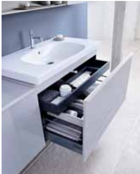
Stauraum spielt bei Keramag Acanto eine wichtige Rolle. Der Waschtischunterschrank beispielsweise ist mit zusätzlich einsetzbaren Ordnungsboxen vielseitig nutzbar und bietet genügend Platz für Handtücher, Pflegeprodukte und Co.

Das Möbelkonzept der Badserie Keramag Acanto erlaubt eine individuelle Badgestaltung. Die Möbel können als reine Waschplatzlösung mit Waschtisch, Unterschrank und Spiegelschrank oder als Konzeptlösung eingesetzt werden. Bei der Konzeptlösung können die einzelnen Möbeltypen frei zusammengestellt werden – je nach Raumgröße oder benötigtem Stauraum. So passt zum Beispiel der Hängeschrank in Höhe und Ausladung zum Spiegelschrank.