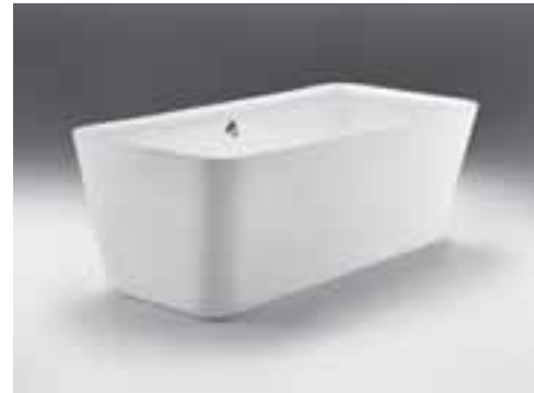
KAMEA (oben) und VIELO (unten)