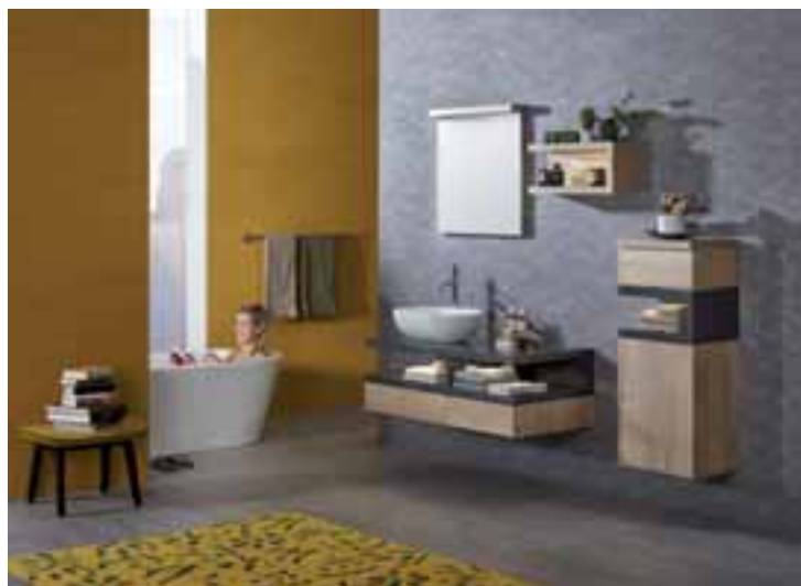
Ein Bad das zeigt, was man hat: Badmöbel Foqus - LED-belichtete, tribünenförmige Regalelemente in Farb- und Materialkontrasten betonen die dreiteilige, vertikale Gliederung und setzen Accessoires stimmungsvoll in Szene. Hier ein Designvorschlag in Graphit Glanz mit OpenCubes in Avio Lärche und einem Mineralguss-Waschtisch.