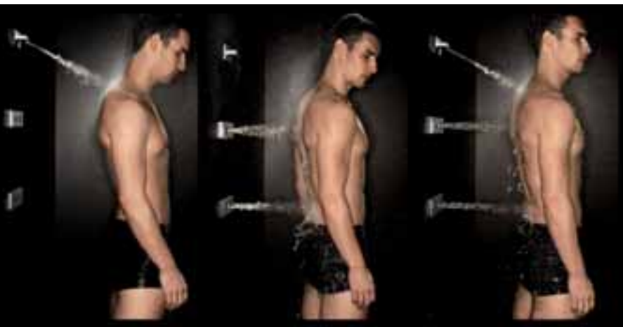
Während WaterCurve den Bereich von Nacken und Schultern abdeckt, sorgt WaterFan für eine Massage auf Höhe der Brustwirbel sowie im Bereich der Lendenwirbel.

Für die wirkungsvolle und zugleich komfortable Anwendung von Aquapressur im eigenen Bad hat Dornbracht die Massagedüsen WaterFan und WaterCurve entwickelt. Während WaterCurve den Bereich von Nacken und Schultern abdeckt, sorgt WaterFan für eine Massage auf Höhe der Brustwirbel (WaterFan vertical) sowie