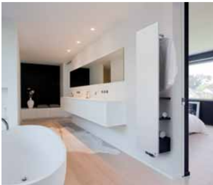
Niva Bad nutzt den Wandabstand und schafft so zusätzlichen, praktischen Stauraum im Badezimmer.

Das Badezimmer dient immer mehr als persönliche Wellness-Oase, um das Wohlbefinden zu steigern. Ruhe und Entspannung stehen an erster Stelle, wobei Funktionalität und Formgebung Garant für eine entsprechende Atmosphäre sind. Die starke Verbundenheit mit den Menschen von heute und der von ihnen gewünschten Lebensumgebung sind Teil der Vision von Vasco. Das Ergebnis: Ein umfangreiches Angebot an Designheizkörpern für das Badezimmer – aus Aluminium oder Stahl, in Weiß oder in Trendfarben, für den Betrieb mit Zentralheizung oder Elektrizität, mit oder auch ohne funktionale Accessoires.