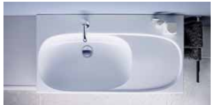
Ein optisches Highlight ist der Waschtisch mit integrierter Ablagefläche auf der rechten Seite, auf der Badaccessoires platziert werden können. Diese Fläche ist direkt in die Gesamtform eingebettet und liegt etwas tiefer als der umschließende Waschtischrand.

Zum Portfolio der Sanitärkeramik gehören Standardwaschtische mit verschiedenen Ausladungen mit und ohne Ablagefläche sowie reine Möbelwaschtische im „Slim Rim“-Design. Die Slim Rim-Modelle bilden mit ihren besonders schmalen Kanten und kleinen Radien eine homogene und in sich geschlossene Einheit mit den Möbeln. Die Waschtische lassen sich ideal mit den Badmöbeln kombinieren und sind optimal aufeinander abgestimmt. Praktisch ist auch der verdeckte keramische Überlauf, der direkt in die Keramik integriert ist und somit keinen zusätzlichen Platz benötigt.