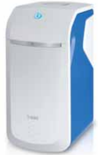
Bild 1: Die neue Perlwasseranlage BWT Perla ist ein Meisterstück der Innovation. Ein erweitertes Serviceangebot, Konnektivität und ein noch nie dagewesenes Designkonzept zeichnen sie aus.

Unverändert blieb nur die Luxusklasse der BWT-Spitzenleistung, die diese Anlage bietet: Wasser, das ein Badezimmer in eine Wellnessoase verwandelt: Zarte Haut, glänzendes Haar wird mit seidenweichem BWT Perlwasser verwöhnt. Dazu wird die Wäsche anschiessam weich und bleibt in Form. Dieser Mix aus Servicequalität auf allen Ebenen zeichnet die Marke BWT nun mehr aus denn je: Bedienerfreundlichkeit der Anlage auf nie dagewesenem Niveau in Kombination mit bester Qualität für die Endkunden.