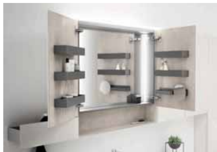
Die innere Rückseite des Spiegelschranks ist vollflächig mit einem Spiegel und an den Seiten und oben mit Licht versehen, während beide Flügeltüren über Ablagefächer verfügen. So sind alle benötigten Dinge für den Nutzer immer in Reichweite und er selbst hat freie Sicht in den Spiegel.