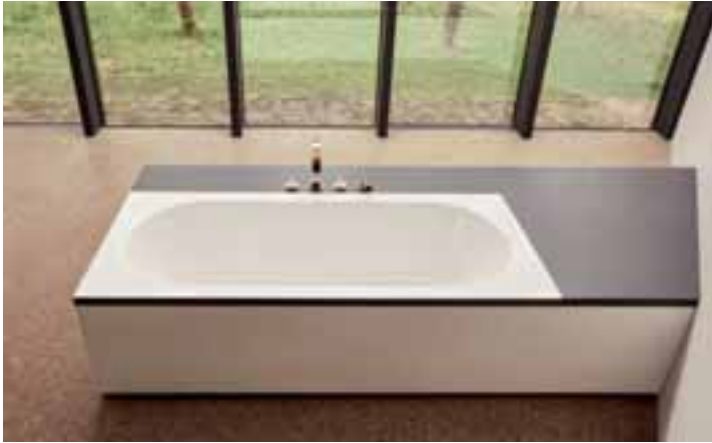
Oval, Rechteck und ein brillantes Material: Die BetteStarlet Spirit ist mit ihrem hauchdünnen Wannenrand die aktualisierte Version eines echten Klassikers im Bad.