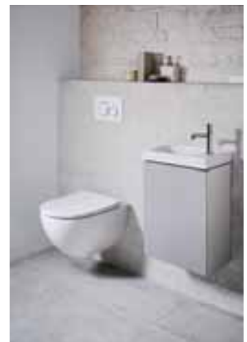
Für Gästebäder und kleine Badezimmer gibt es von Keramag Acanto kompakte Handwaschbecken mit kurzer Ausladung. Am spülrandlosen WC gibt es kaum verborgenen Stellen, an denen sich Schmutz und Ablagerungen bilden können.

Für architektonisch anspruchsvoll gestaltete oder kleine Badezimmer bietet Keramag Acanto einen platzsparenden Waschtisch mit kurzer Ausladung an. Für Gästebadzimmer gibt es kompakte Handwaschbecken. Ein optisches Highlight ist der Waschtisch mit integrierter Ablagefläche auf der rechten Seite, auf der Badaccessoires platziert werden können. Diese Fläche neben dem