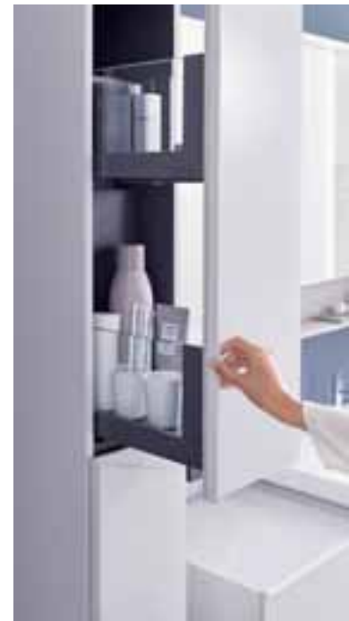
Der Hochschrank ist auch in einer schmalen, raumsparenden Variante mit Apothekerauszug erhältlich. Er kann als Raumteiler eingesetzt werden und das Badezimmer optisch in einzelne Bereiche.

Abgerundet wird das Möbelprogramm durch ein Wandboard mit einer Glas-Front, die zugleich Handtuchhalter und Ablagefläche ist. Beinahe scheinen sie vor der Wand zu schweben. Das Wandboard kann – wie alle Möbel der Serie – einzeln oder direkt neben dem Spiegelschrank platziert werden, da es die Höhe des offenen Regals am Spiegelschrank aufgreift. Fotos: Keramag ><